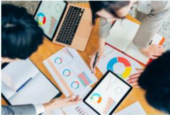
サウンディングサポート